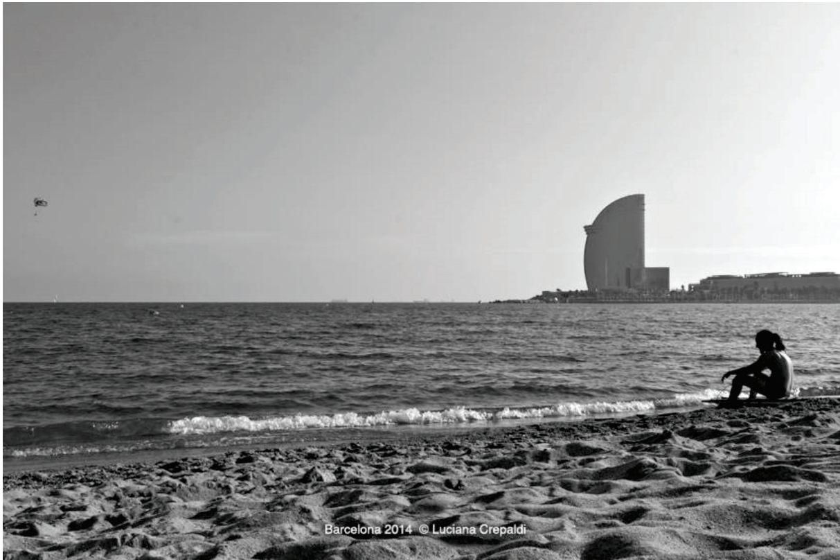
Figura 7 [fotografía: Luciana Crepaldi, 2014]