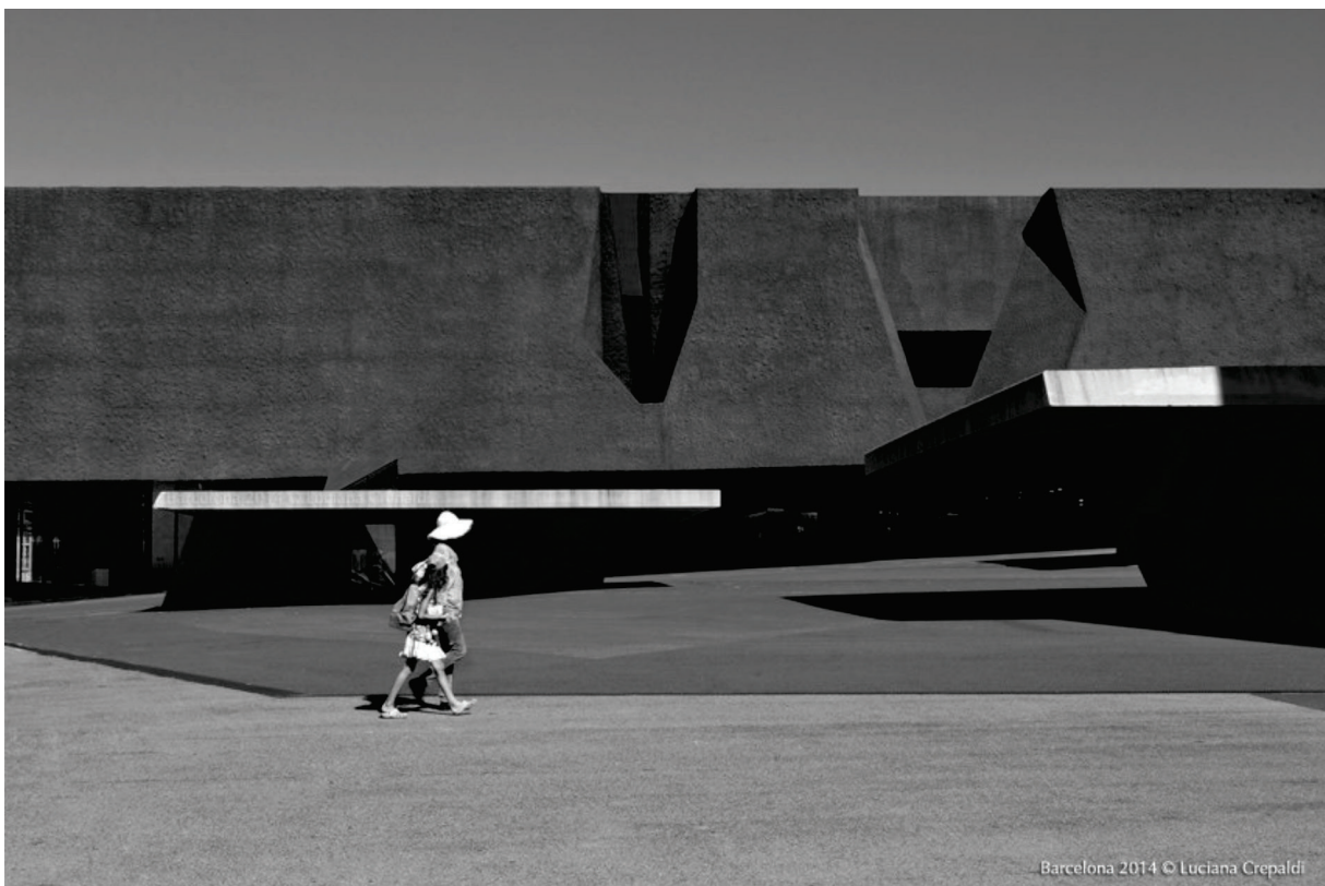
Figura 5