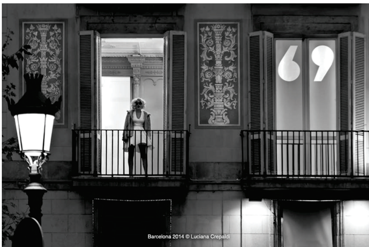
Figura 4