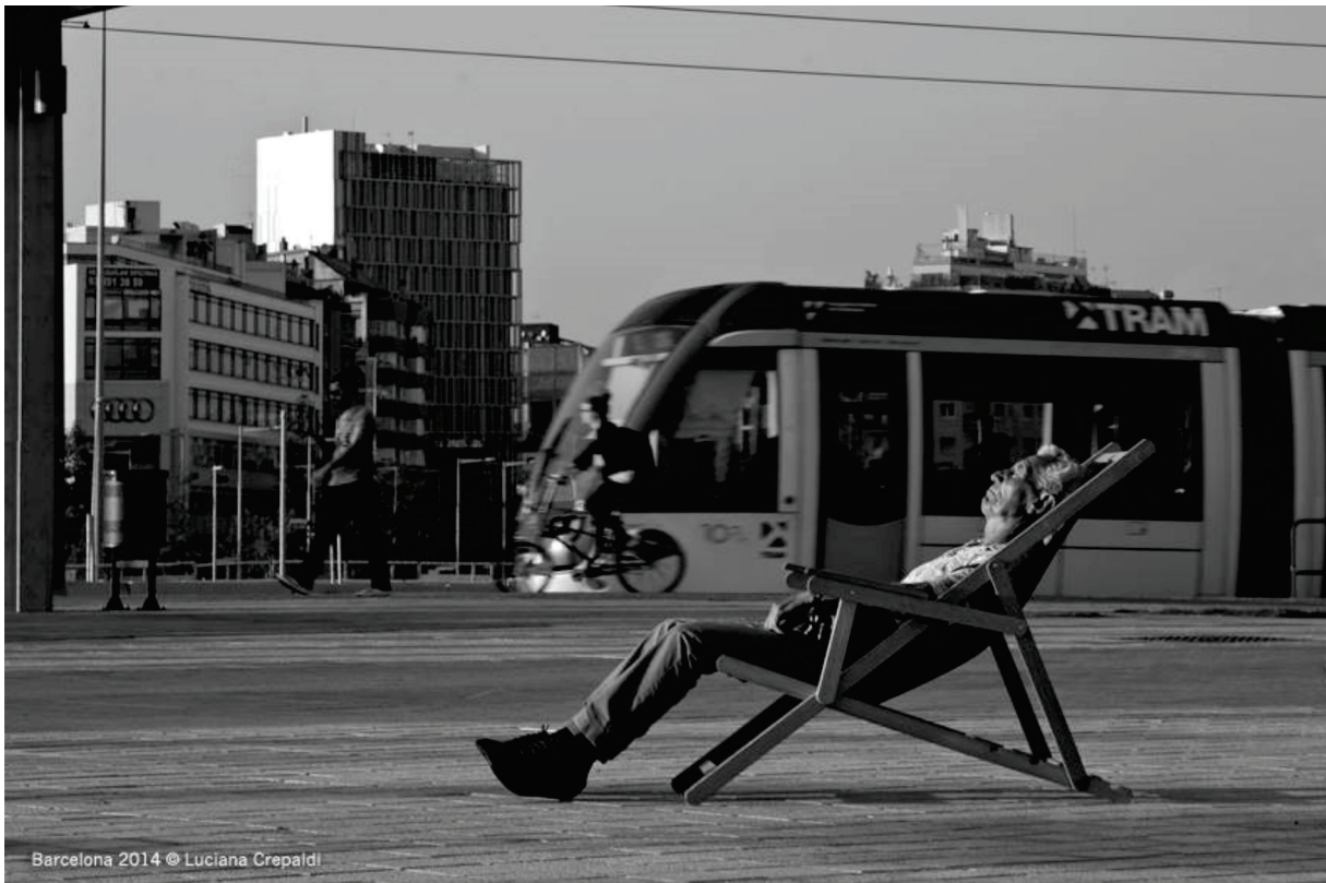
Figura 10 [fotografía: Luciana Crepaldi, 2014]