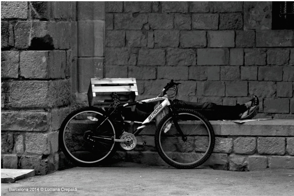
Figura 8