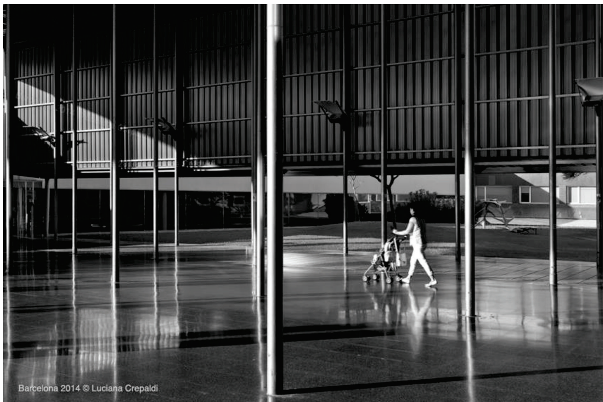
Figura 6 [fotografía: Luciana Crepaldi, 2014]