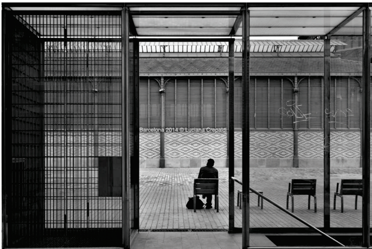
Figura 9