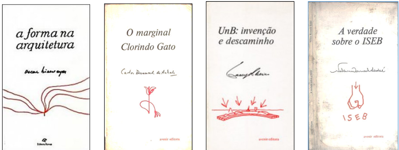
Figura 1 – Capas dos primeiros volumes da Coleção Depoimentos, 1978.