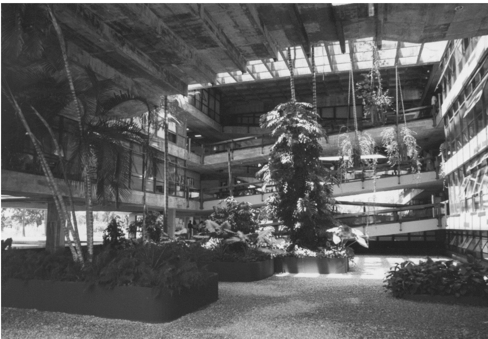
Figura 4 – Reitoria. Fonte: CEDO-C-UNB.

O prédio da Reitoria foi projetado por Paulo de Mello Zimbres, com a colaboração de Érico Weidle, e executado de 1972 a 75. O edifício da Administração Central pode ser considerado como um dos mais importantes entre os que compõem o Campus Universitário. Uma construção de base quadrada, toda erguida em concreto armado aparente, que resulta do jogo inteligente entre os diferentes níveis de dois blocos retangulares paralelos e afastados entre si. Cada pavimento guarda um desnível de meio pé-direito em relação ao imediatamente inferior (que corresponde ao bloco adjacente), de maneira que um sistema de rampas transversais e contínuas interliga todos os níveis, no qual cada patamar corresponde a um pavimento. Entre os dois blocos, desenvolve-se um grande