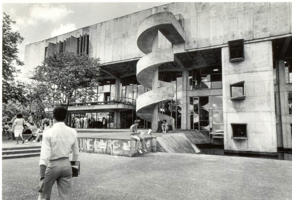
Figura 3 – Restaurante Universitário.

O Restaurante Universitário foi projetado por José Galbinski, com a colaboração Antônio Carlos Moraes de Castro, e executado de 1971 a 74. O edifício é intrigante e inovador. Intrigante por sua forma e concepção estrutural. Inovador por sua proposta original, que inverte a organização tradicional desse tipo de edifício, situando a cozinha no nível mais elevado da construção. Assim, temos uma “caixa” (por vezes cega) de concreto aparente, apoiada em um sistema rígido de pilares cruciformes e elevada cerca de três níveis em relação ao solo. No interior da “caixa” ficam a cozinha e os demais espaços de apoio – tudo preponderantemente ventilado e iluminado zenitalmente. A “caixa” empresta caráter atectônico ao conjunto e, competentemente, esconde o que não