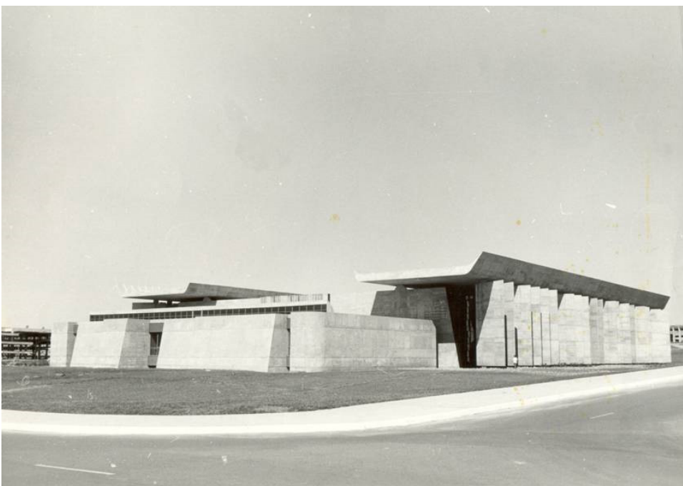
Figura 2 – Biblioteca Central.