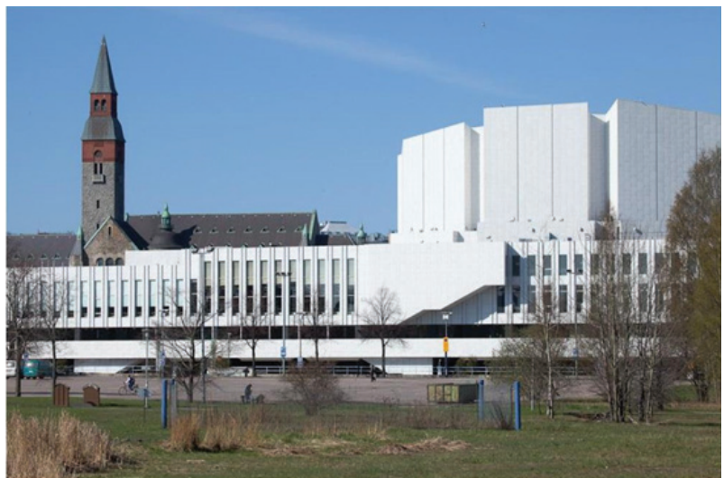
Figura 2 Finlândia Hall (1962) em Helsinki, de Alvar Aalto

Macdonald (1996) aponta outro exemplo de intervenção em um exemplar da arquitetura moderna, em que os blocos de concreto e os elementos vazados da Igreja de Notre Dame du Raincy (1922-1923) (Figura 3), de Auguste Perret, tiveram que ser substituídos gradualmente por conta do aparecimento de fissuras e de instabilidade da estrutura. Nesse caso, novamente