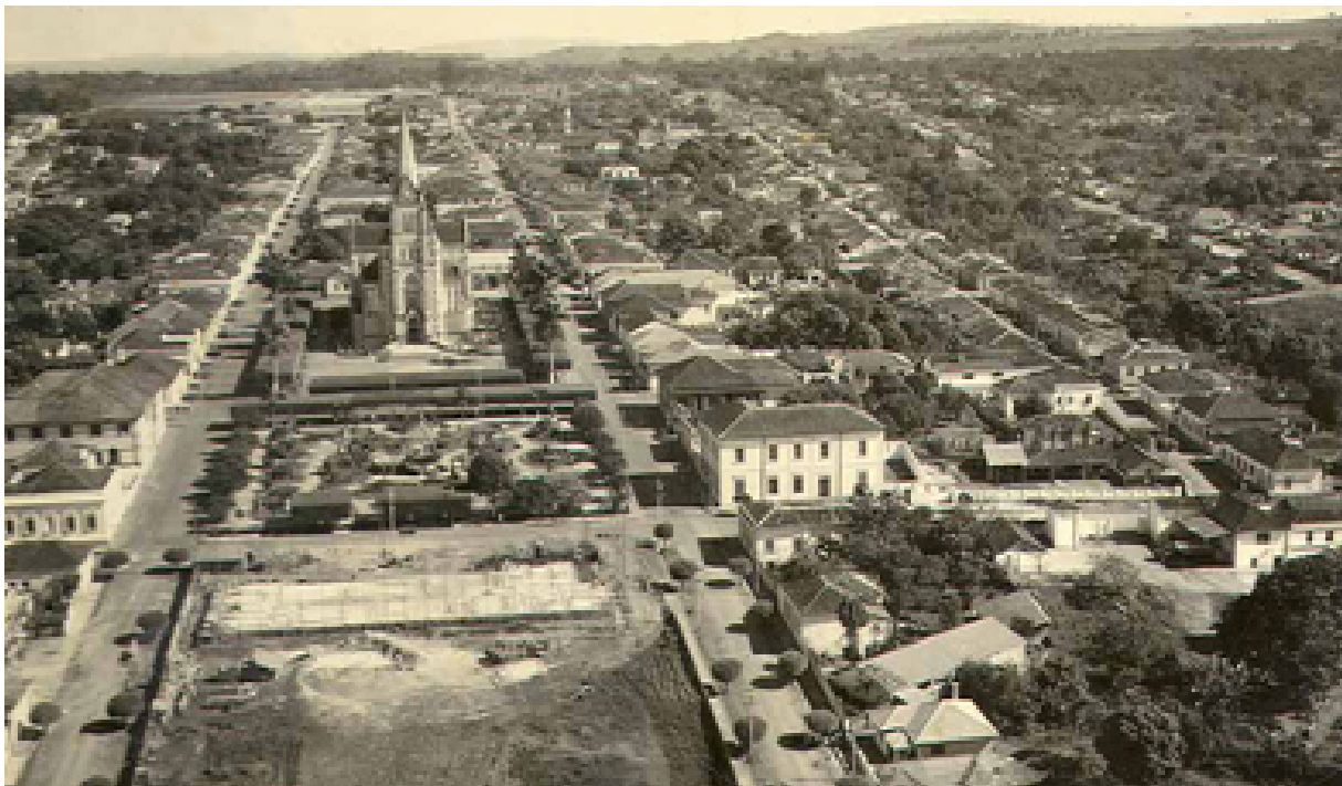
Figura 4 Vista aérea de Santa Rita do Passa Quatro, com a igreja matriz e a praça fronteira.

Por fim, para que essa centralidade do templo se convertesse em malha urbana efetiva, tornou-se necessário traduzir o valor simbólico e institucional do patrimônio religioso em decisões técnicas de traçado, executadas por agentes vinculados à esfera municipal. A materialização do assentamento exigia, portanto, a definição do traçado viário, tarefa atribuída a um arruador indicado pela Câmara Municipal. Diante da escassez de engenheiros e arquitetos no período, esse ofício era comumente desempenhado por agrimensores práticos, responsáveis por desenhar as ruas a partir das condições topográficas do terreno, sem desconsiderar a centralidade da igreja como referência organizadora do núcleo urbano, porém raramente fugindo do traçado regular ortogonal (Ghirardello, 2021, p. 95).