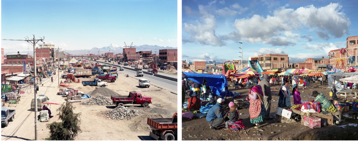
Figura 01 El Alto com forte presença de edifícios com alvenaria exposta e a presença do comércio informal.

sumista dos espaços públicos tradicionais, frequentemente excludentes. A priori, mais do que práticas informais, esses espaços configuram ações que oscilam entre a sobrevivência e o dissenso, operando como formas de crítica política.