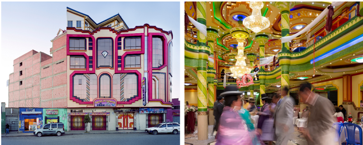
Figura 03 “El Tren Diamante” e seu salão de festas.

Importante mencionar, aqui, um detalhe que acabou ajudando a destacar esse edifício em meio aos outros. Como o seu lote tem uma forma diagonal, a lateral da construção, em tijolo aparente, tem uma presença muito marcante na visão frontal, criando um efeito de trompe-l’oeil que faz ressaltar a planaridade da fachada principal, como se ela fosse uma superfície bidimensional sem espessura, uma espécie de outdoor . Qualidade visual que o fotógrafo Tatewaki Nio percebeu muito bem, criando uma foto muito frontalizada dessa obra, na qual o corpo horizontal do piso térreo comercial se prolonga numa linha contínua em direção ao terreno vizinho, aumentando o surrealismo daquela fachada lateral de tijolo em plano chanfrado, que parece algo impossível.